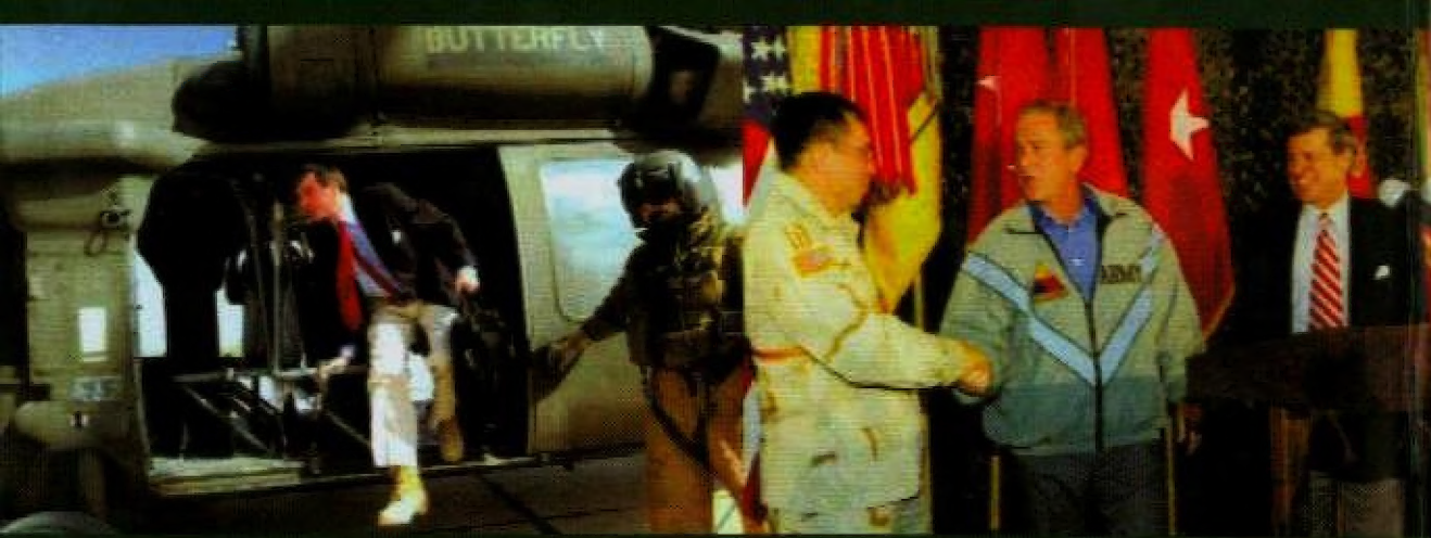
زيارة الرئيس الملاحنة في عيد الشكر